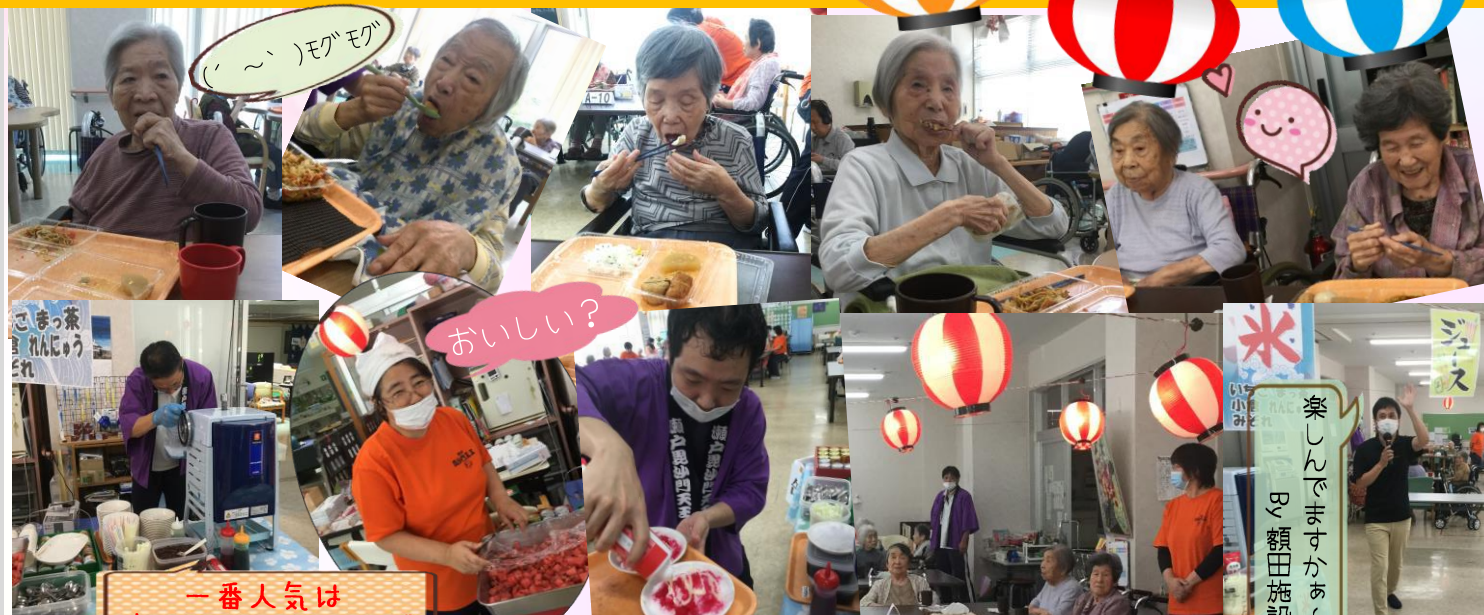
一番人気は すいかのトッピング