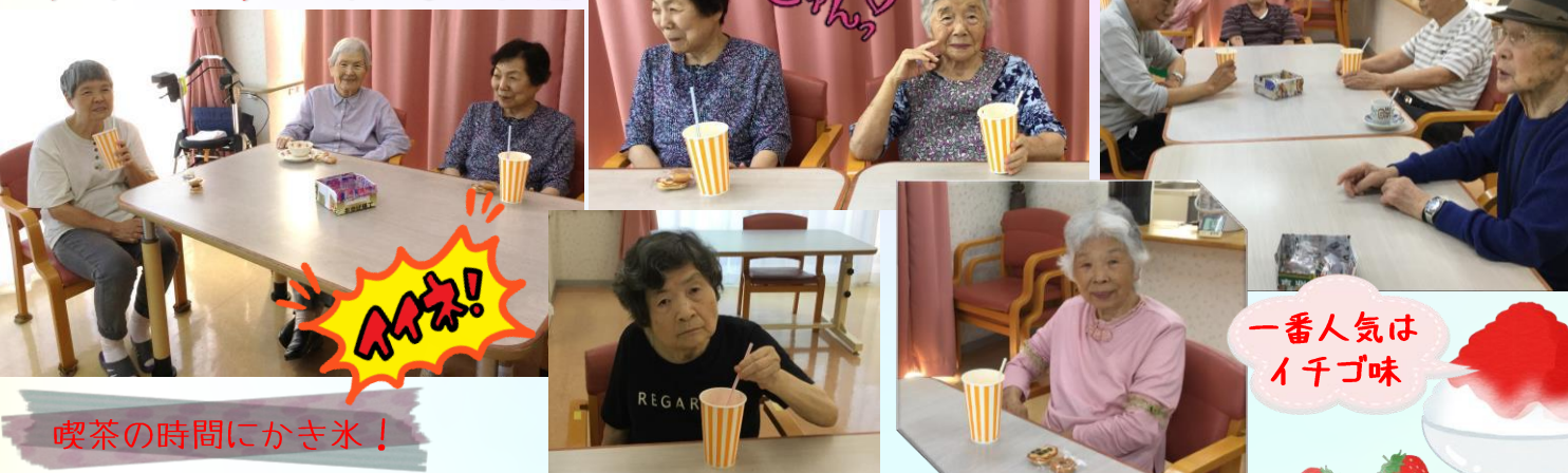
喫茶の時間にかき氷!