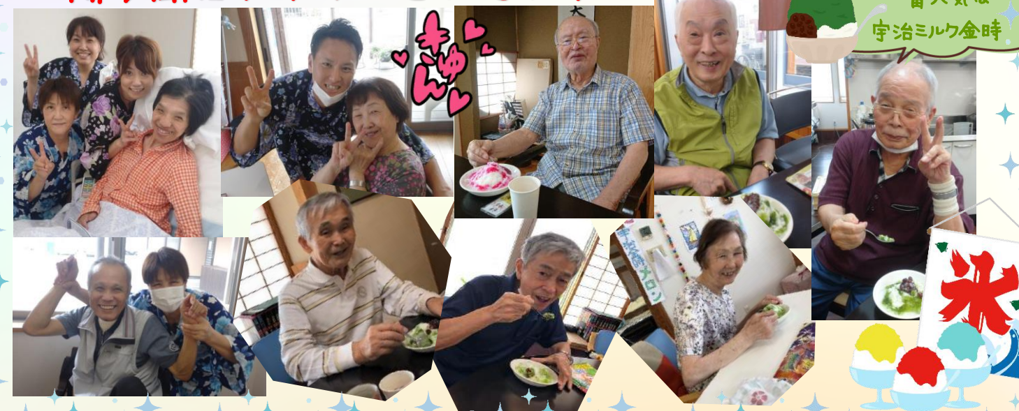
一番人気は 宇治ミルク金時